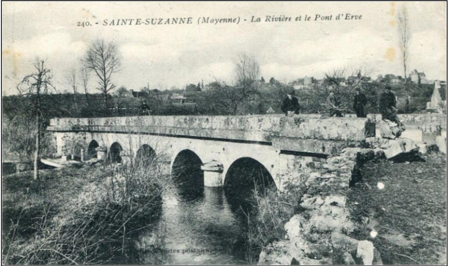
240. - SAINTE-SUZANNE (Mayenne) - La Rivière et le Pont d'Erve