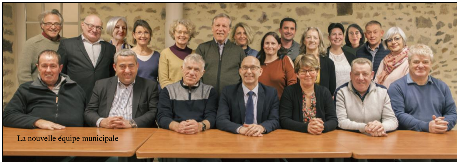
La nouvelle équipe municipale