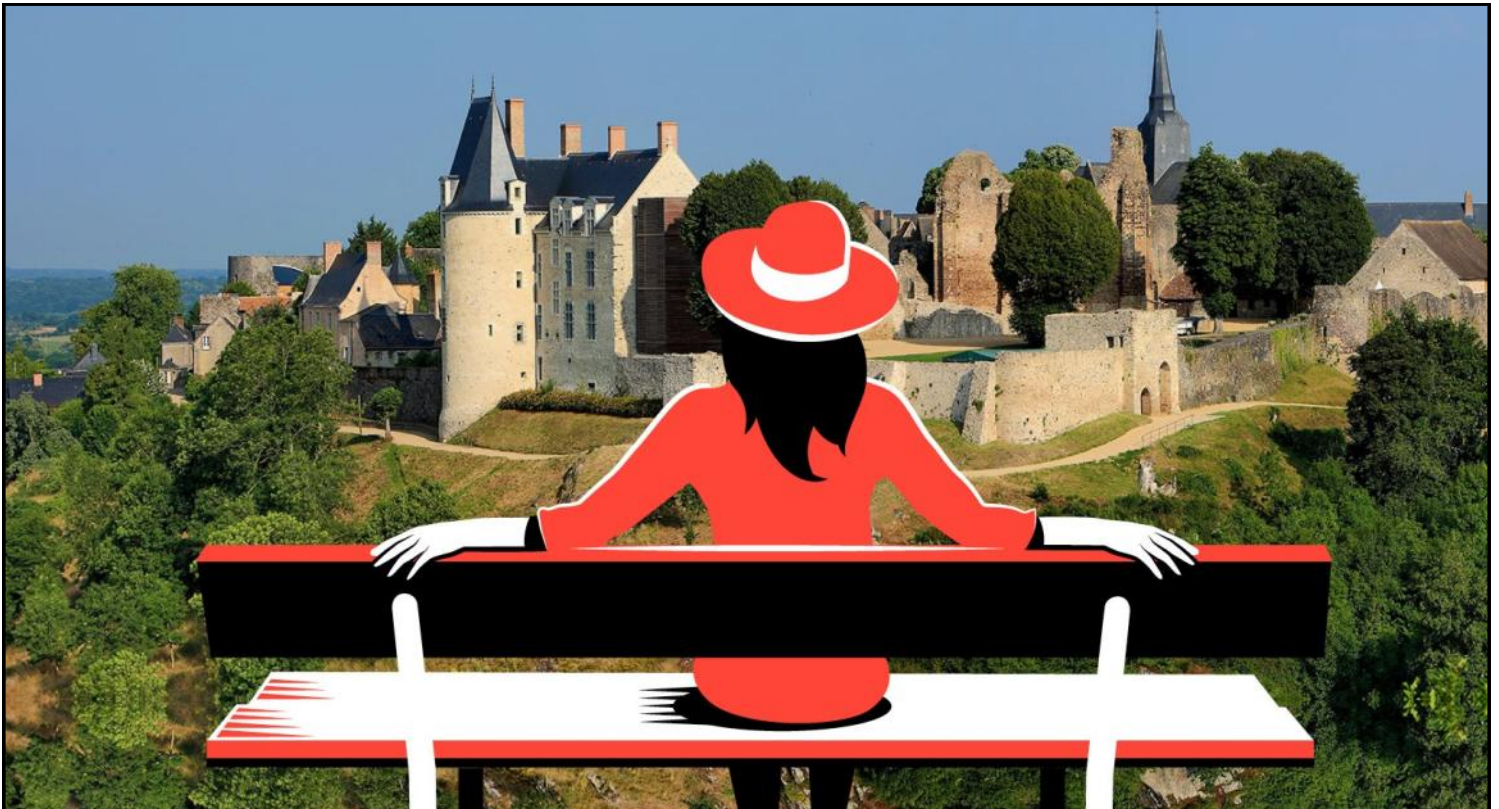
Images de Sainte-Suzanne confinée - Photos ci-dessous prises le vendredi 8 mai 2020 Grande Rue - Rue Jean de Bueil - Rue du Grenier à sel

Ce journal a été imprimé par nos soins le mardi 19 mai 2020