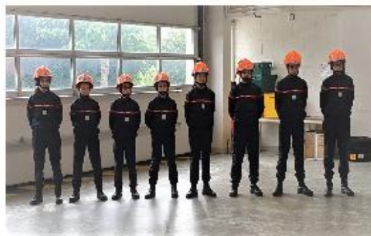
JSP des Coëvrons