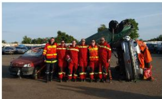
TEAM PEGASE 53