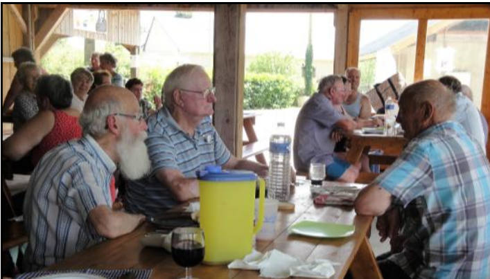
Amicale de l'Erve - Reprise des activités le jeudi 5 septembre