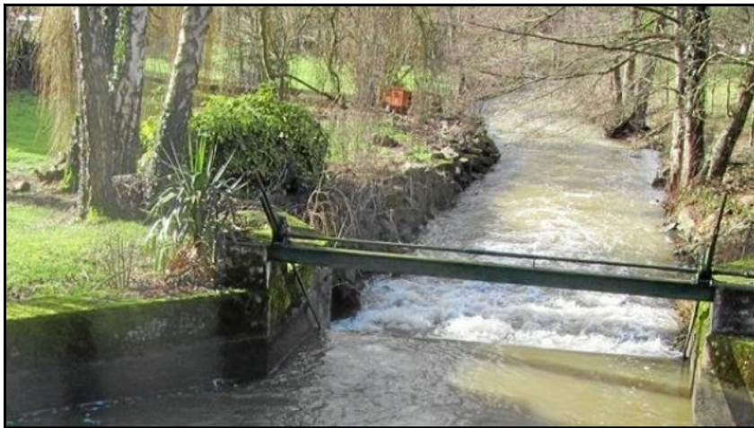
Barrage de la Saugère

Dans le cadre du contrat d'action pluriannuelle de travaux sur les ouvrages hydrauliques de l'Erve pour la période 2017-2021, le syndicat du bassin de l'Erve a chiffré à onze le nombre d'ouvrages concernés, dont six autour de Sainte-Suzanne-et-Chammes: le Grand-moulin à Chammes, la Mécanique, la Saugère, la Logette et Château-Gaillard à Sainte-Suzanne et le moulin de Feuillaume à cheval avec Torcé-Viviers-en-Charnie.