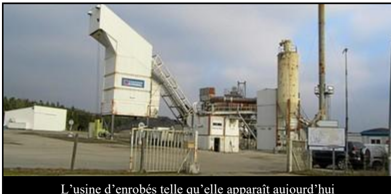
L'usine d'enrobés telle qu'elle apparaît aujourd'hui

Une réunion publique sera organisée le mercredi 15 mars, à 19h, salle Fernand-Bourdin à Sainte-Suzanne.