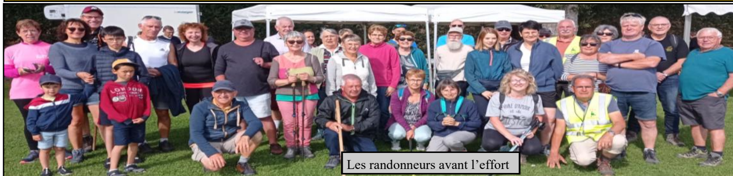
Les randonneurs avant l'effort