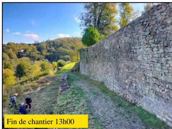
Fin de chantier 13h00

Nous espérons que la prochaine journée citoyenne aura encore plus de succès et que nous pourrons continuer encore plus nombreux à restaurer et entretenir le patrimoine de notre cité afin que les habitants, les promeneurs de passage et les touristes puissent trouver une promenade de la poterne des plus agréables à faire.