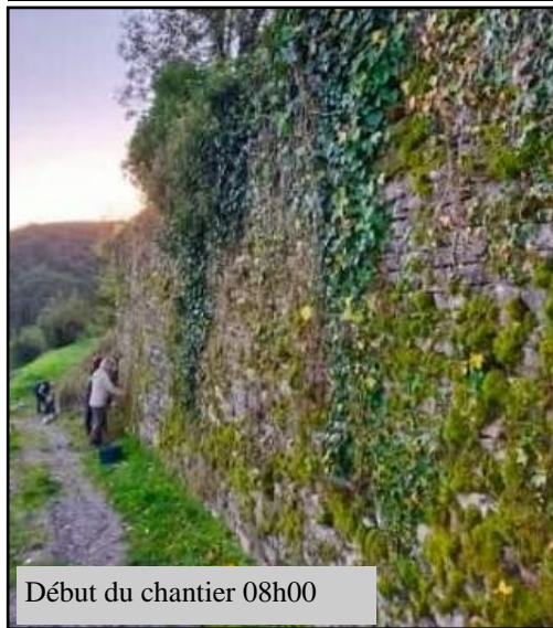
Début du chantier 08h00

La municipalité a organisé la première journée citoyenne le samedi 23 octobre dernier, une dizaine de volontaires ont répondu à l'appel. Nous avons voulu renouveler ces journées qui permettaient aux suzannais de participer à l'entretien du patrimoine des chemins et des sentiers pour le plaisir de tous.