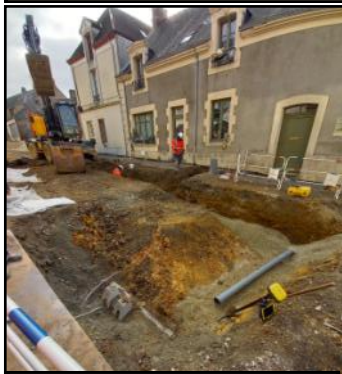
Reprise des embranchements des eaux usées

La première phase de travaux réalisée par la régie des eaux des Coëvrons pour la rénovation des réseaux d'adduction d'eau potable et d'évacuation des eaux usées rue de la Libération est achevée. Elle s'est déroulée selon le calendrier prévu avec peu de surprise pour l'instant en dehors d'une veine de rocher qui a imposé une durée d'une semaine supplémentaire de la fermeture du carrefour de la rue du Petit Rocher. Une rue qui porte bien son nom !