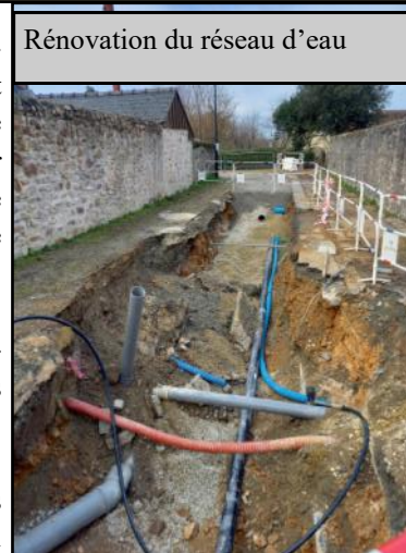
Rénovation du réseau d'eau

La deuxième phase de travaux va être lancée rue de Montsûrs , en cas de difficultés d'accès à votre domicile ou pour tout autre problème, contactez la mairie qui a mis en place une veille et assure le lien avec les entreprises qui interviennent sur le chantier, auprès du secrétariat de la mairie au 02 43 01 40 10 , via l'application intramuros , ou par mail à contact@ste-suzanne.com Dans la poursuite des travaux d'entretien et de remise en état des cheminements et des espaces naturels de la poterne, les travaux d'entretien se poursuivent avec un nouveau chantier versant est.