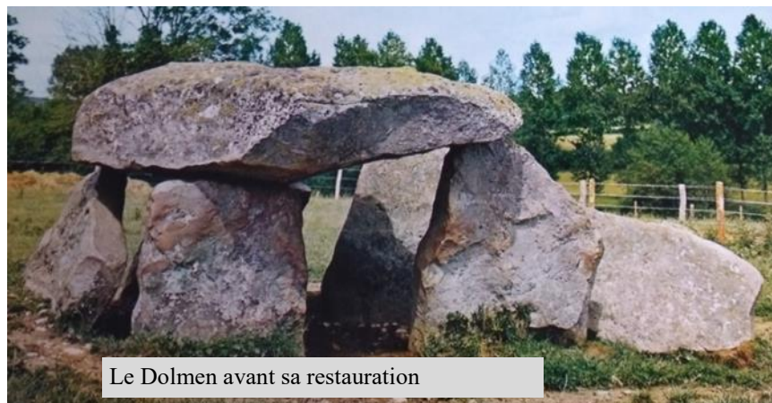
Le Dolmen avant sa restauration