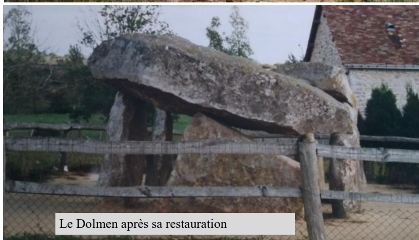
Le Dolmen après sa restauration

L'association des Amis de Sainte Suzanne fut consternée par le travail réalisé par l'équipe d'archéologues. Sans rentrer dans les détails scientifiques et techniques, il leur fut reproché de ne pas avoir repositionné la dalle principale de 13 tonnes à l'horizontal comme elle l'avait toujours été, de l'avoir fait reposer sur 3 piliers (orthostats) au lieu de 4 et de l'avoir trop écartée de la seconde dalle qui fut, quant à elle, repositionnée à l'envers.