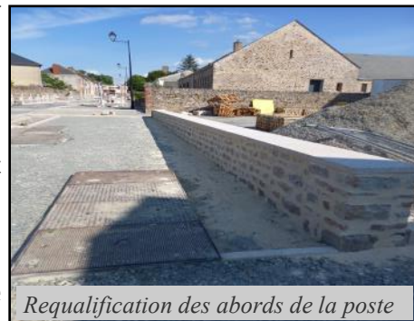
Requalification des abords de la poste

La phase de travaux intègre la création de trottoirs à l'entrée de l'école Perrine Dugué, au carrefour rue du Petit-rocher, rue Claude de Bouillé et route de Montsûrs.