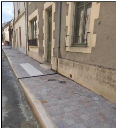
Création de trottoirs pour sécuriser la sortie des habitations rue de la Libération

Les travaux d'aménagement rue de la Libération continuent selon le calendrier prévu avec la finalisation des trottoirs comprenant le pavage et les entrées de garage. Les riverains vont désormais bénéficier de trottoirs sécurisant les sorties des habitations, les largeurs permettent de circuler en toute sécurité. Ils sont adaptés aux personnes âgées à mobilité réduite. La rue, désormais, à sens unique va limiter la circulation de véhicules qui l'empruntaient souvent à grande vitesse. Des aménagements qui devraient permettre d'éviter le stationnement anarchique sur les trottoirs.