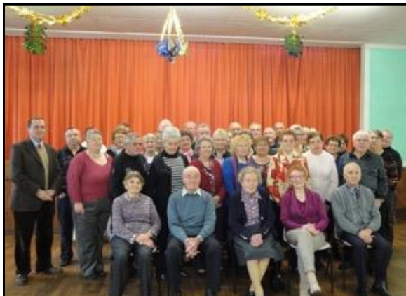
Repas du CCAS de Chammes