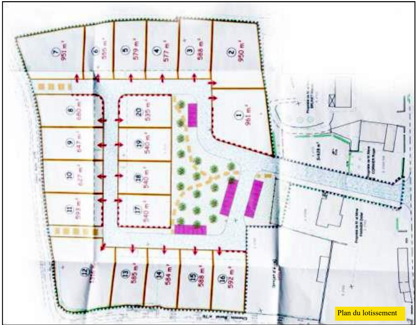
Plan du lotissement