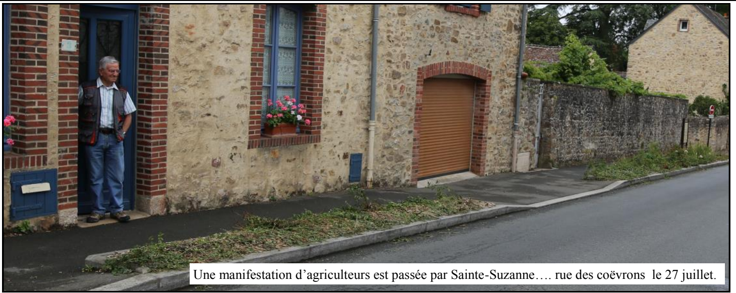
Une manifestation d'agriculteurs est passée par Sainte-Suzanne.... rue des coëvrons le 27 juillet.