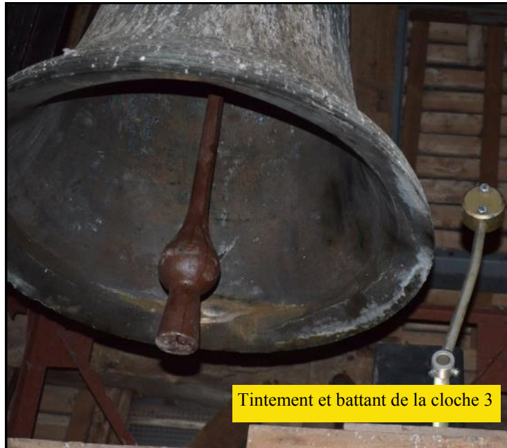
Tintement et battant de la cloche 3

Décembre 2013, l'entreprise GOUGEON de Villdômer (37) chargée de la maintenance campanaire a mis en évidence des dysfonctionnements importants sur les cloches de l'église et leur mécanisme.