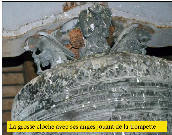
La grosse cloche avec ses anges jouant de la trompette