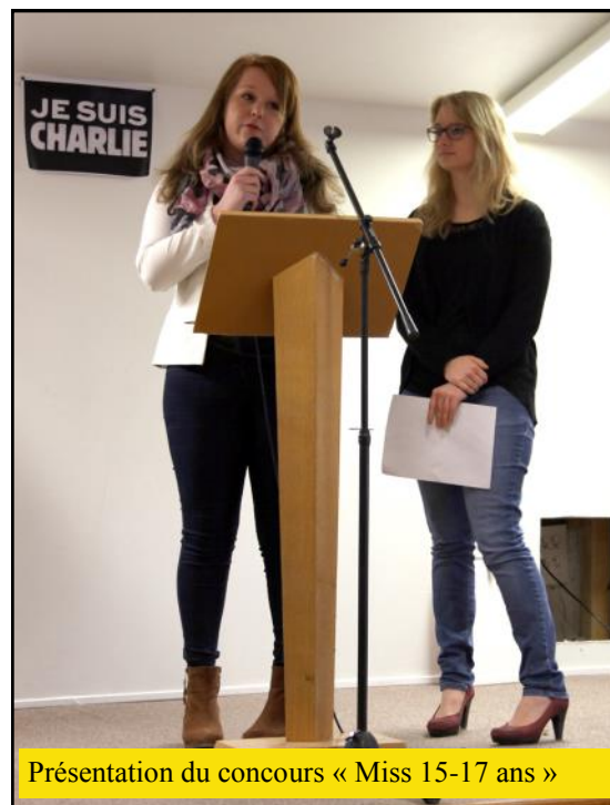
Présentation du concours « Miss 15-17 ans »

Spectacle de dresseurs d'ours le 13 septembre dans le cadre de l'installation à Sainte-Suzanne de l'entreprise apicole "l'ours authentique".