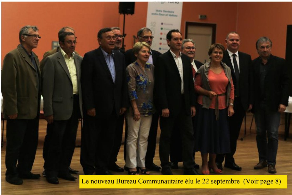
Le nouveau Bureau Communautaire élu le 22 septembre (Voir page 8)

Je ne pars pas fâché, je pars serein et confiant avec le sentiment du devoir accompli et avec des finances saines, bien que nous soyons confrontés comme les autres communautés de communes à la diminution considérable par l'État de nos crédits de fonctionnement. Maintenant la roue tourne, il faut que la 3C passe à une autre organisation que j'appelle de mes vœux.