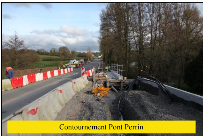
Contournement Pont Perrin