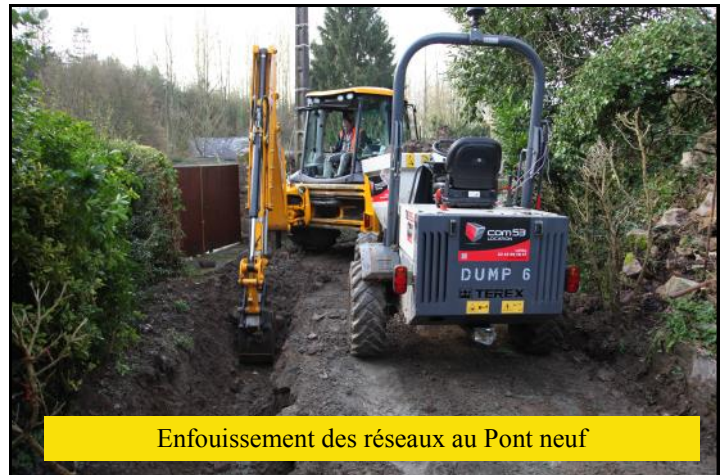
Enfouissement des réseaux au Pont neuf