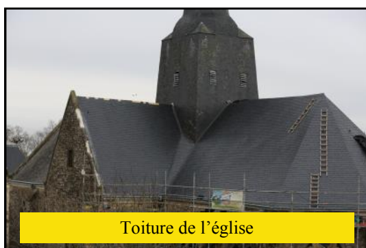
Toiture de l'église