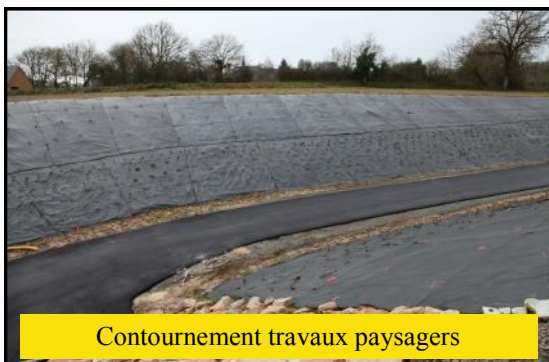
Contournement travaux paysagers