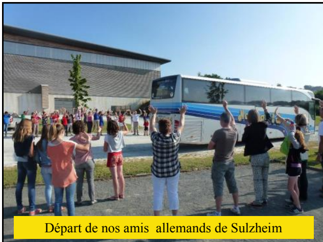
Départ de nos amis allemands de Sulzheim