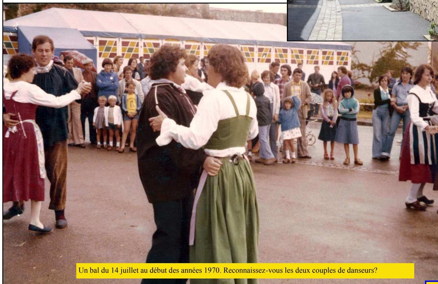
Un bal du 14 juillet au début des années 1970. Reconnaissez-vous les deux couples de danseurs?