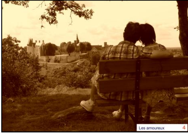
Les amoureux 4

Prix jeunesse : Marie Poirier (photo n°39)