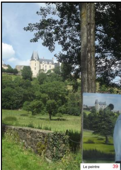
Le peintre 39