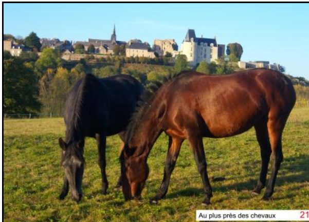
Au plus près des chevaux 21