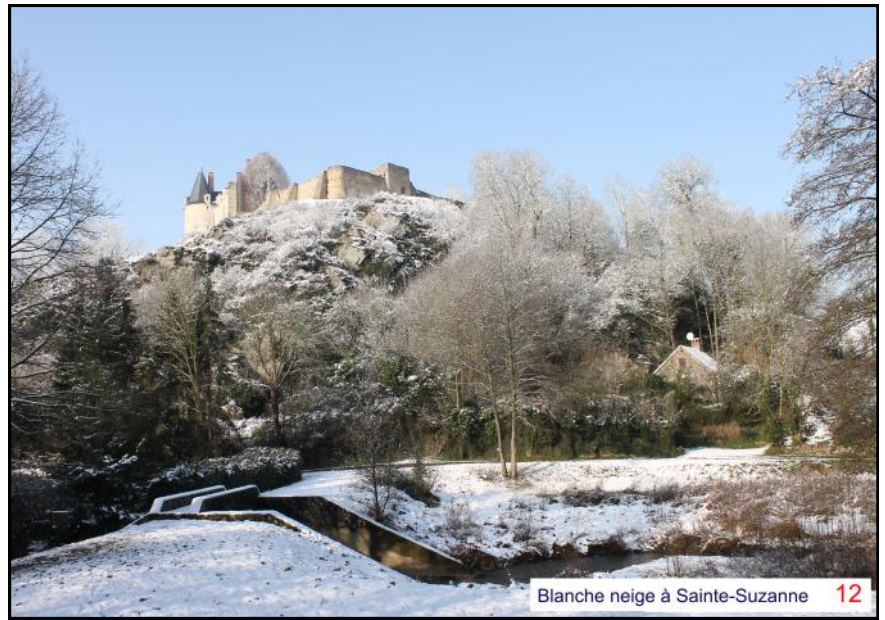
Blanche neige à Sainte-Suzanne 12