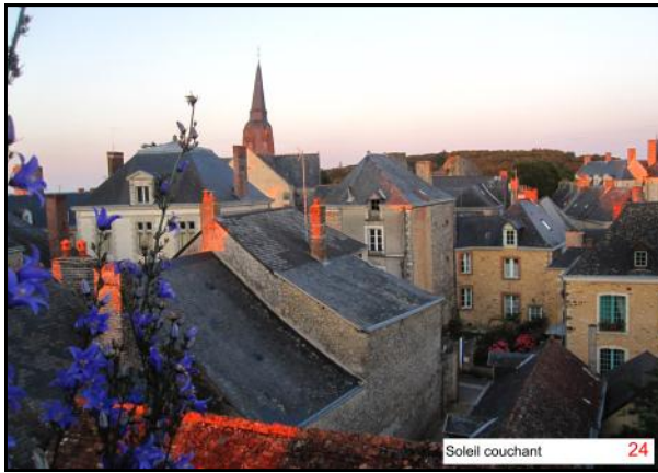
Soleil couchant 24