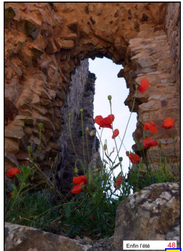
Enfin l'été 48