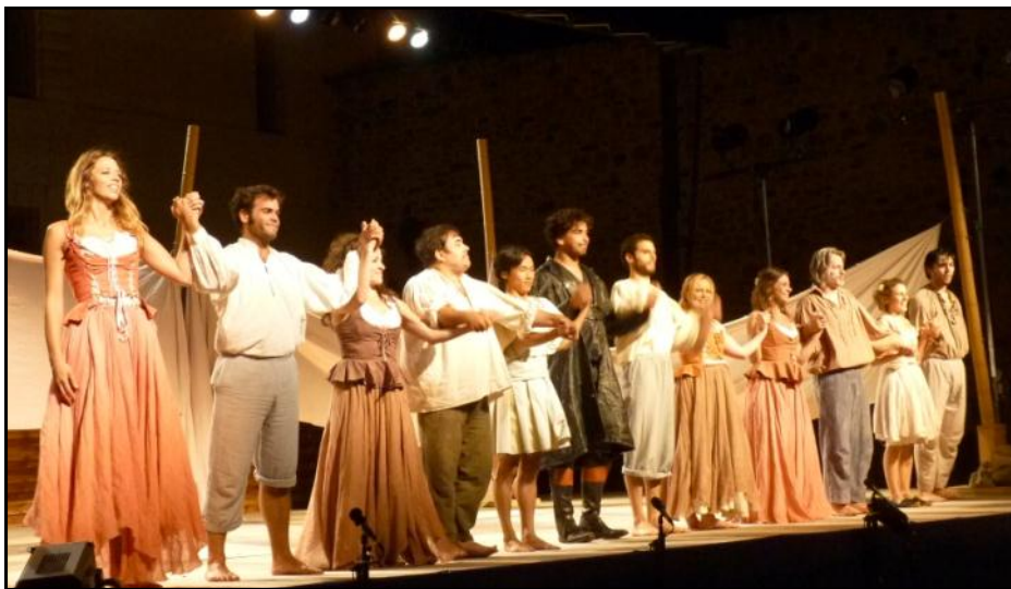
Les Nuits de la Mayenne en images