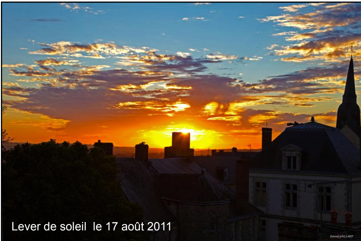
Lever de soleil le 17 août 2011

Selon leur estimation, le voyage devrait durer un an et demi et se terminera là où il a commencé.