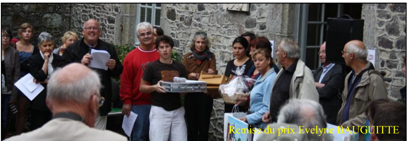
Remise du prix Evelyne BAUGUITTE