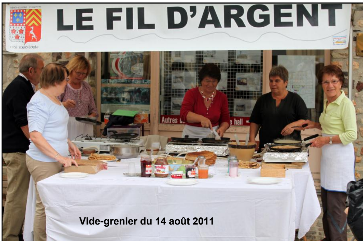
Vide-grenier du 14 août 2011

« Les Courtileries » Le chemin des Courtileries réunit le hameau du Pont-Neuf à celui du Gohard. Un courtil est un petit jardin attenant à une maison paysanne. Les Courtileries étaient donc l'ensemble de ces petits jardins situés autour des maisons.