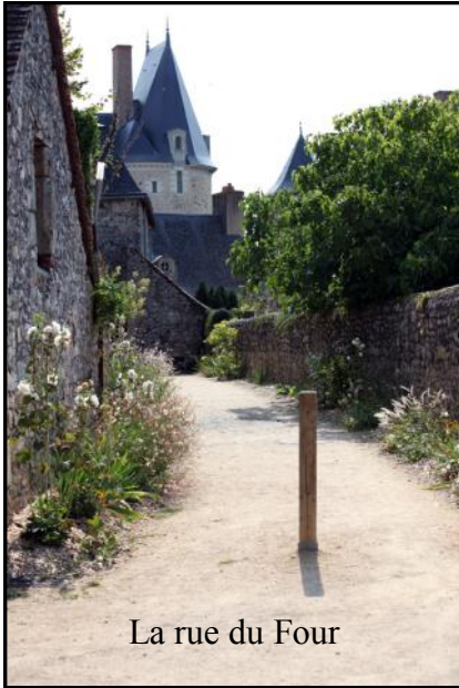
La rue du Four

Des noms de lieux du village nous sont familiers, mais quelle est leur origine ?