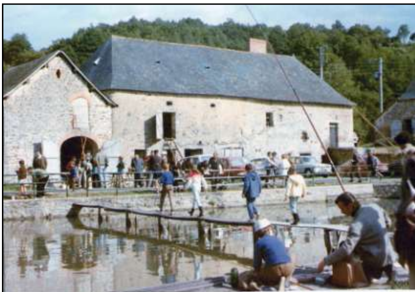
Illustration : Concours de pêche à la "piscine" du Grand-moulin.

NB : Les photos seront scannées et restituées aussitôt à leur propriétaire. Le livre sera publié en 2012.