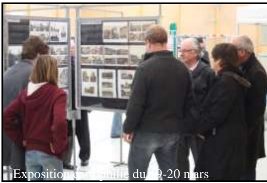
Exposition consacrée du 19-20 mars