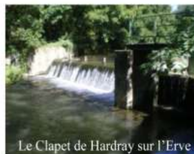
Le Clapet de Hardray sur l'Erve