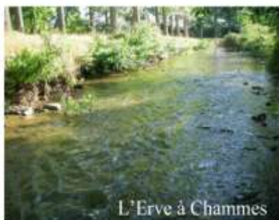
L'Erve à Chammes