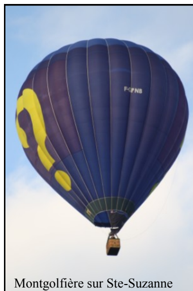
Montgolfière sur Ste-Suzanne