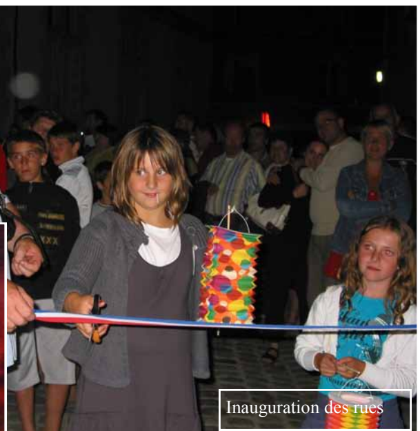
Inauguration des rues