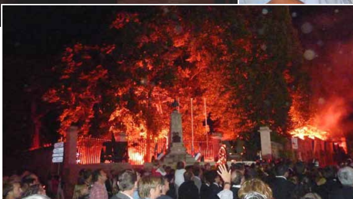
Embrasement de la Butte Verte