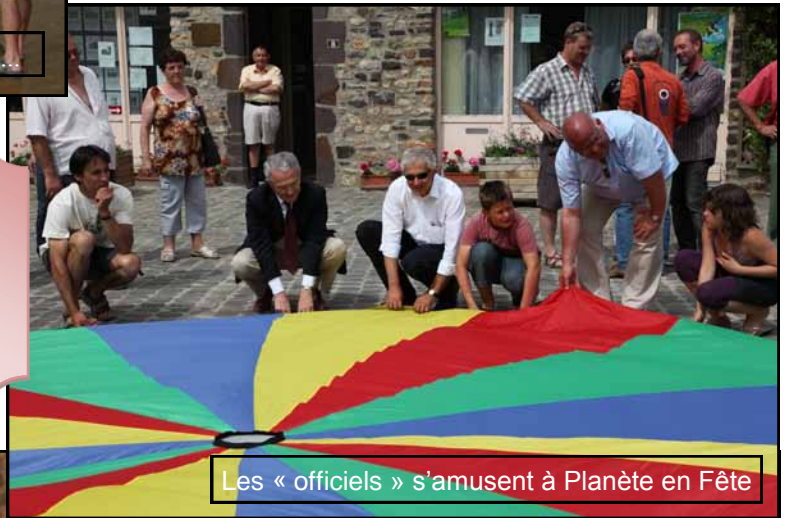
Les « officiels » s'amuse à Planète en Fête