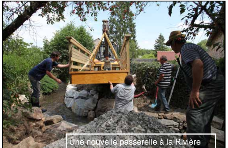
Une nouvelle passerelle à la Rivière

info@coevrons-tourisme.com nuitsdelamayenne@libertysurf.fr tél : 02 43 53 63 90