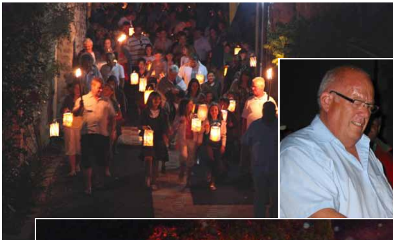
Retraite aux flambeaux