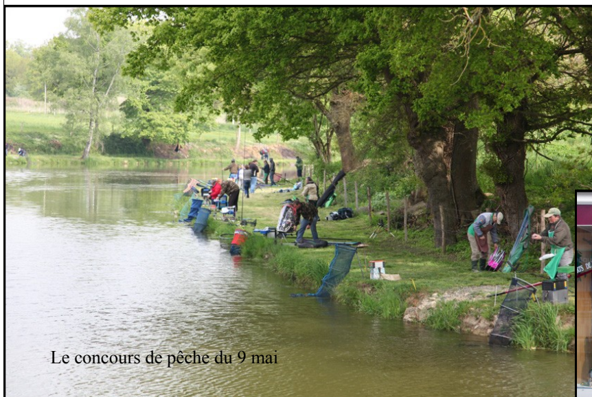
Le concours de pêche du 9 mai