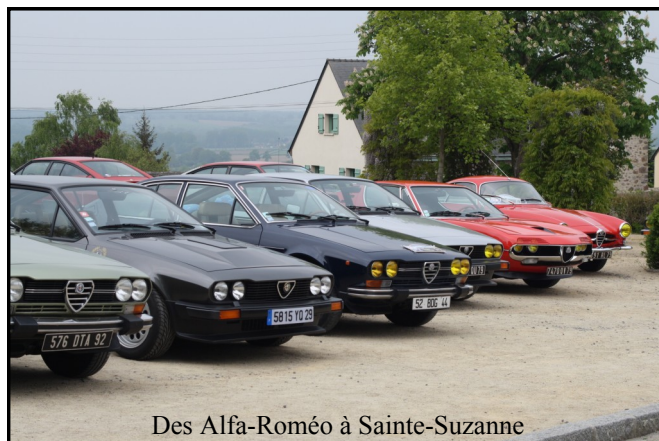
Des Alfa-Roméo à Sainte-Suzanne