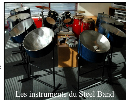
Les instruments du Steel Band