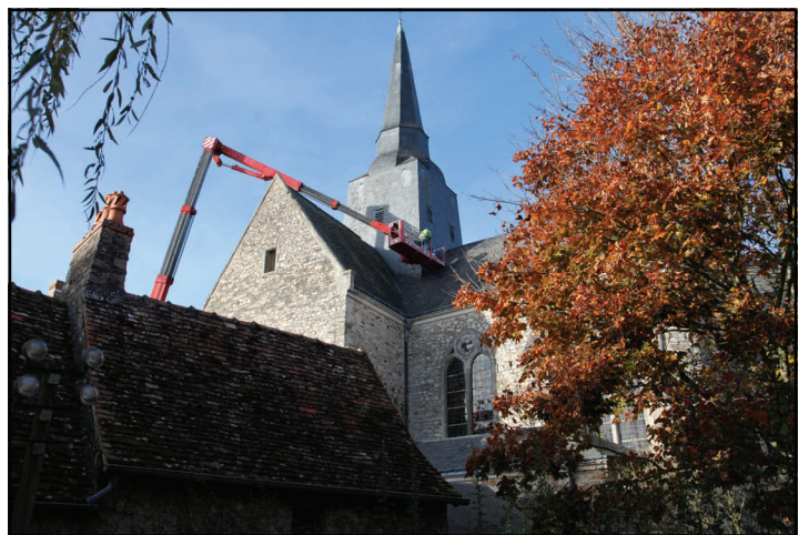
Ces photos ont été prises lors de l'entretien de la couverture du clocher.