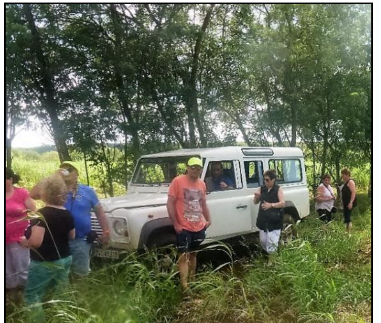
Excursion en 4X4 à Basse-Terre (noix de coco, cannes à sucre)